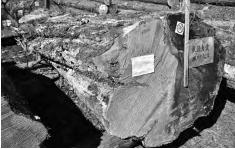
最優秀賞（林野庁長官賞） 角石林業株式会社（樹種：クリ）