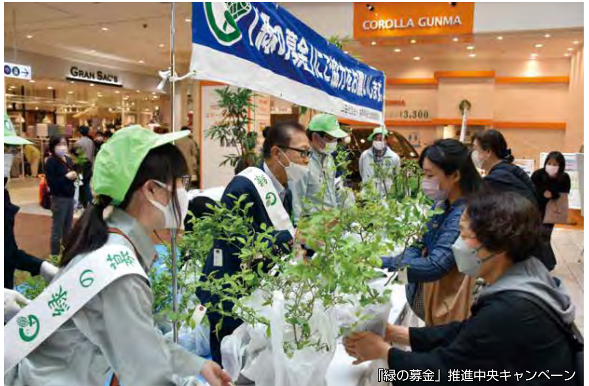
「緑の募金」推進中央キャンペーン

また会場には、県内各地の緑の少年団による様々な地域緑化活動への取り組みを紹介するパネル展示や、樹木医による緑化相談も行われ、多くの来場者に緑の大切さが周知されていました。