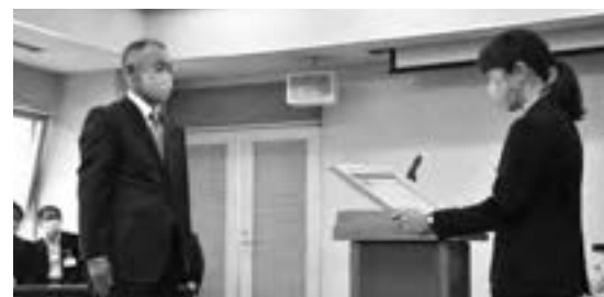
最優秀賞・群馬県知事賞 金井生産森林組合

ぐんまの木を使うことが、ぐんまの森林を守ります。 木材の可能性を拓く、JAS構造材をご使用ください。