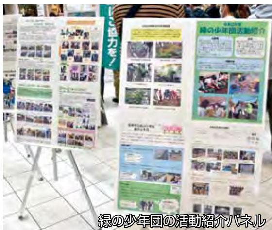
緑の少年団の活動紹介パネル