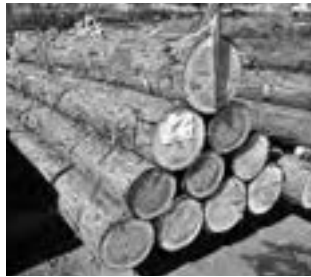
有限会社内山林業 （樹種：ヒノキ）