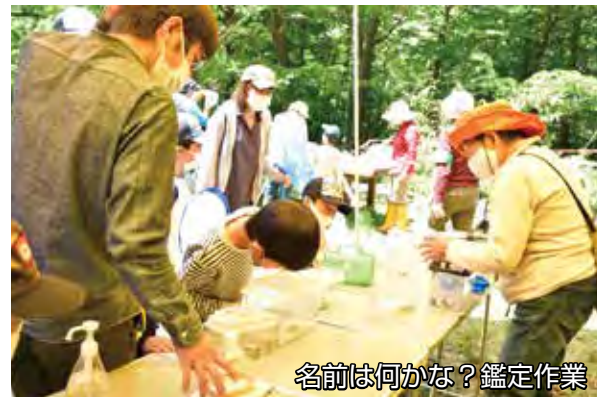
名前は何かな？鑑定作業