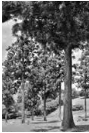
表紙 八王子山公園（太田市）