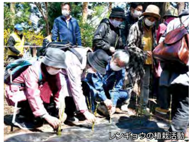
レンギョウの植栽活動