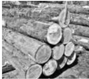
立石木材株式会社 （樹種：スギ）

群馬県素材生産流通協同組合では、優良素材の生産奨励と素材生産技術の向上を図ることを目的に、上州産優良素材展示会を毎年開催しています。