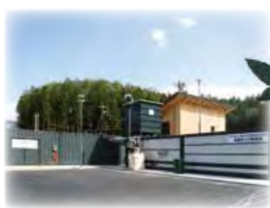
木質バイオマス発電「森林の発電所」