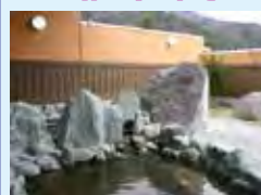
天狗の湯 露天風呂

吾妻渓谷温泉郷(川中温泉、松の湯温泉) 浅間隠温泉郷(鳩ノ湯温泉、薬師温泉) コニファーいわびつ ■日帰り温泉 あづま温泉桔梗館 吾妻温泉根古屋の湯 吾妻峡温泉天狗の湯