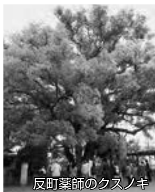
反町薬師のクスノキ