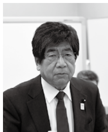
群馬県山林種苗 緑化協同組合