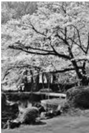
表紙 子持ふれあい公園（渋川市）