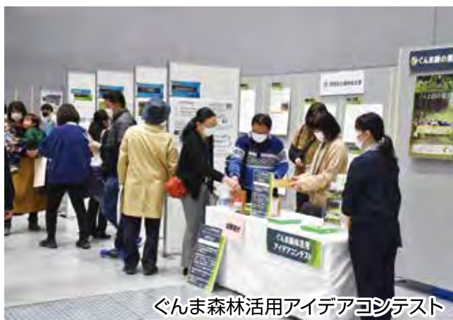
ぐんま森林活用アイデアコンテスト