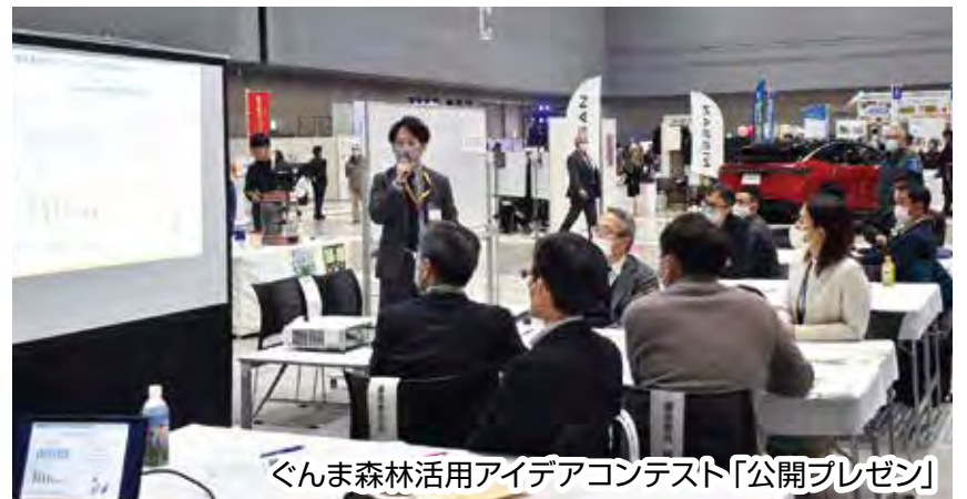
ぐんま森林活用アイデアコンテスト「公開プレゼン」

同会場では、脱炭素への取組が新しい未来の暮らしをより豊かにすること、県民自らの選択が自立分散型の社会実現につながることを「知り・触れ・体感」する機会とすることを目的とした「脱炭素ライフスタイルフェア」も同時開催され、電気自動車や再生可能エネルギーなどに関するブースが展開されていました。