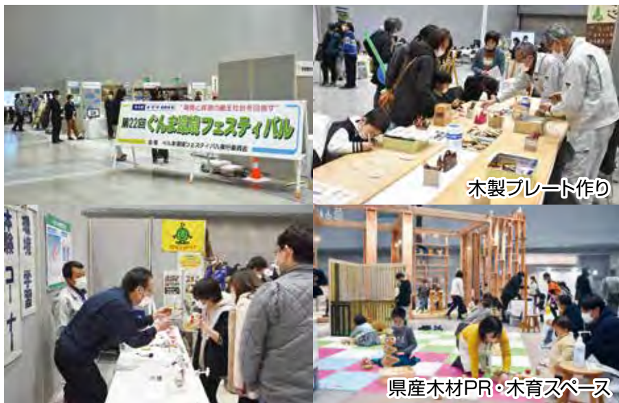
木製プレート作り