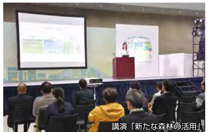
講演「新たな森林の活用」