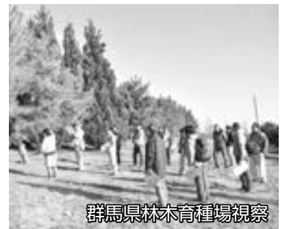
群馬県林木育種場視察

令和5年12月15日、令和5年度林業用苗木新規生産希望者研修会が開催され、渋川市内の林業用苗木生産者の苗畑や群馬県林木育種場の現地研修が行われました。