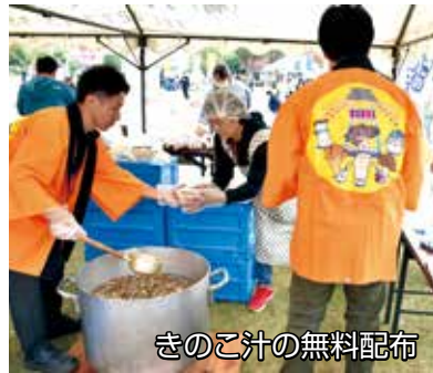
きのこ汁の無料配布