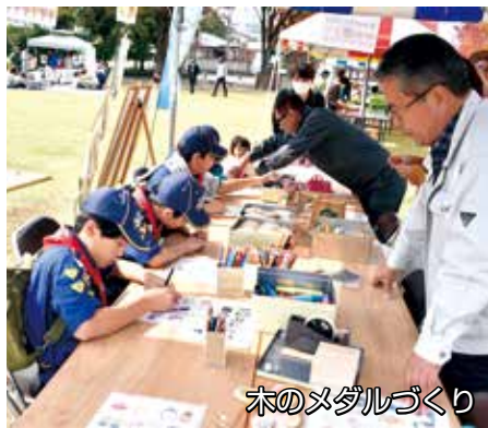
木のメダルづくり