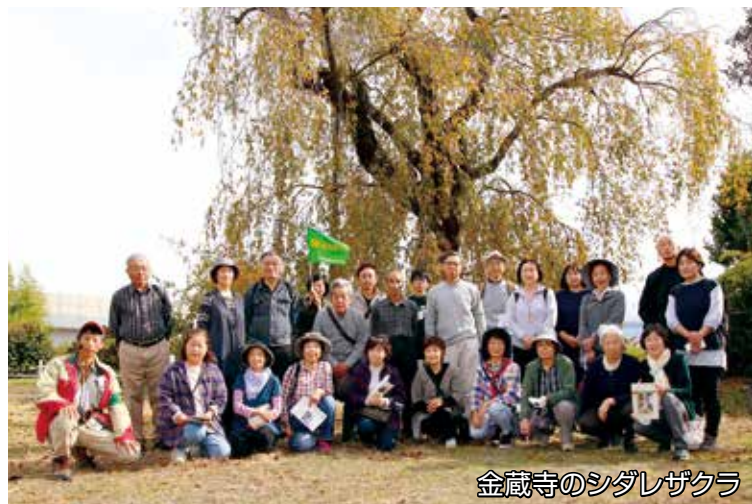
金蔵寺のシダレザクラ

群馬県では、山や森に親しみ、学び、その恵みに感謝し、これを守る取り組みとして、県内で森林や自然に関わる団体を中心に県民参加型のイベントを募集し、広く県民に発信し自然にふれあう機会を提供しています。