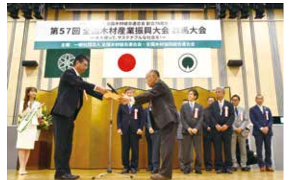
第57回全国木材産業振興大会表彰者 (敬称略・群馬県受賞者のみ抜粋)