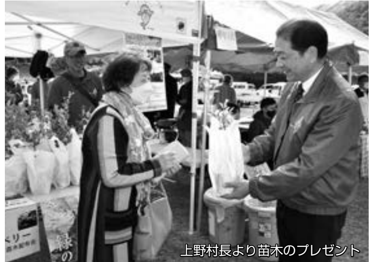
上野村長より苗木のプレゼント