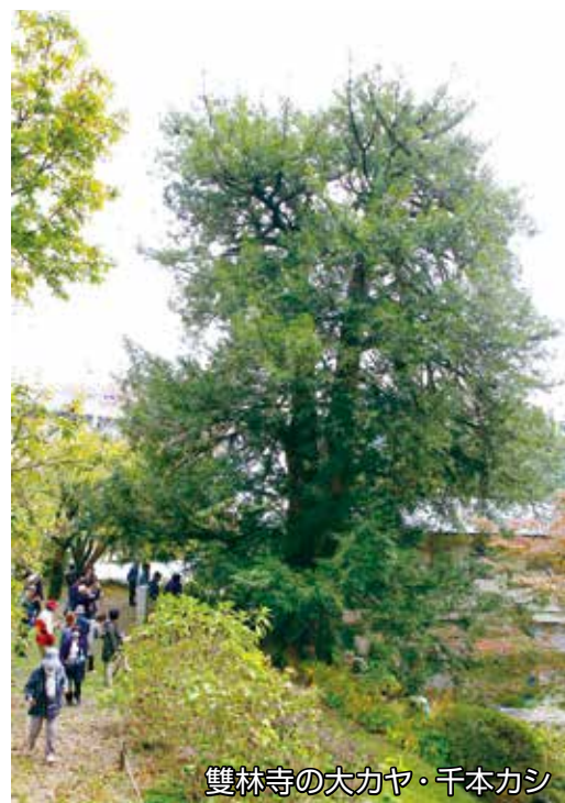
雙林寺の大カヤ・千本カシ