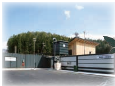
木質バイオマス発電「森林の発電所」