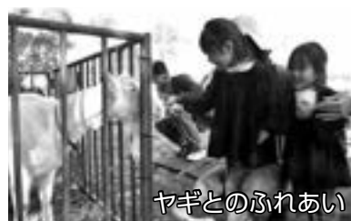
ヤギとのふれあい