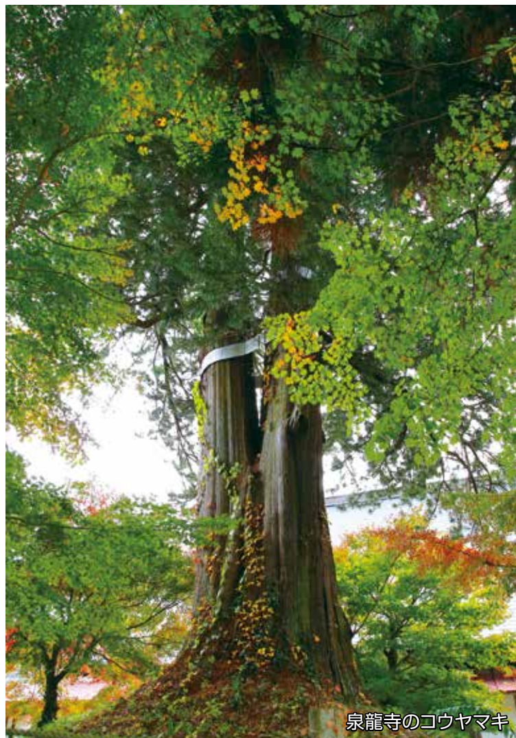
泉龍寺のコウヤマキ

吾妻コースでは、渋川市や東吾妻町、中之条町、高山村の4市町村を巡り、推定樹齢800年の泉龍寺のコウヤマキをはじめ、雙林寺の大カヤ・千本カシなど、地域の歴史を見守り続けてきた巨樹・古木の姿に、参加者は目を奪われて見入っていました。