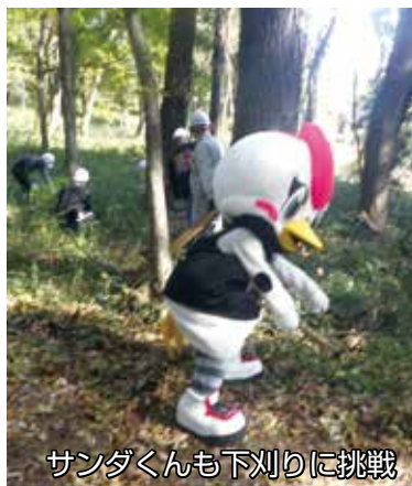
サンダくんも下刈りに挑戦