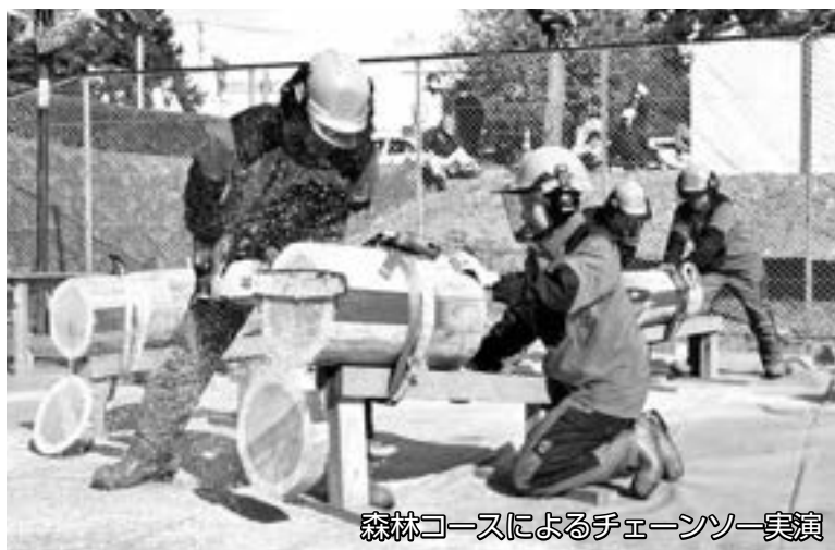
森林コースによるチェーンソー実演