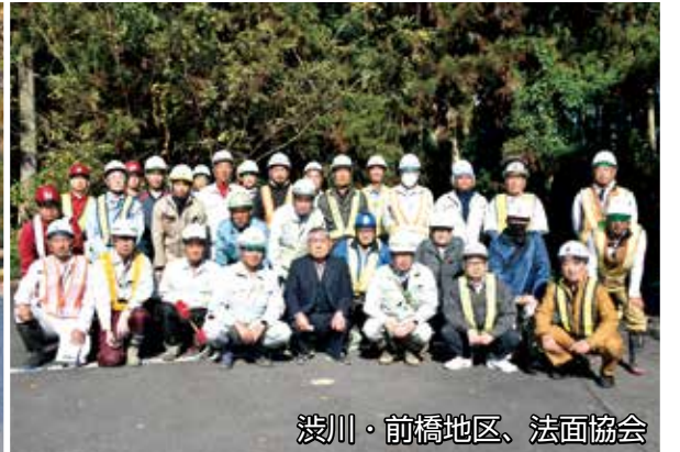
渋川・前橋地区、法面協会