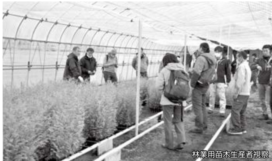
林業用苗木生産者視察