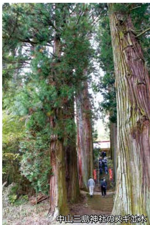
中山三島神社のスギ並木